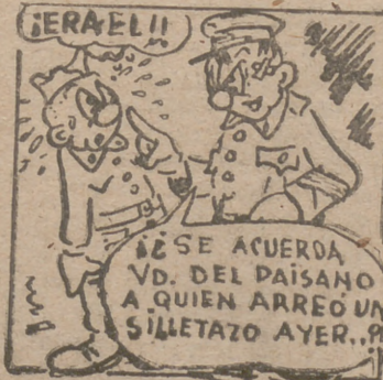
"Lo quiso la suerte"