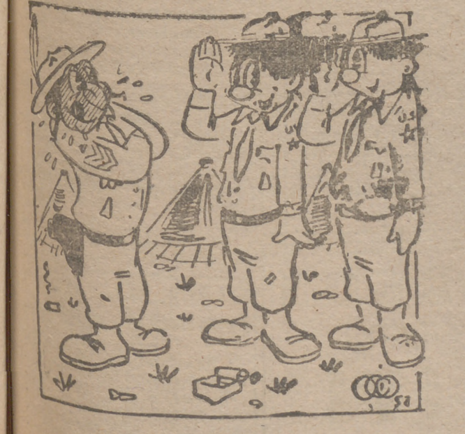
— Parece que te hemos caído bien a nuestro sargento, ¿verdad? ...