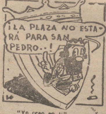
"Yo creo en ti."