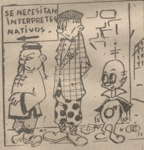
Sin 33 1952.