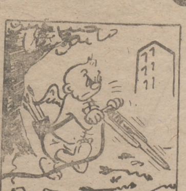
"Corazón de Piedra"