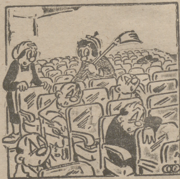
— ¡Menudo rollo debió ser la película de anoche...!