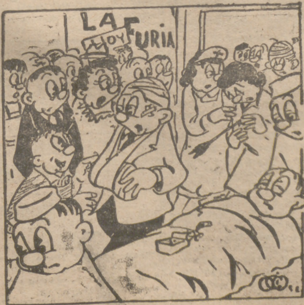
Es de tiros y de indios, verdad?!