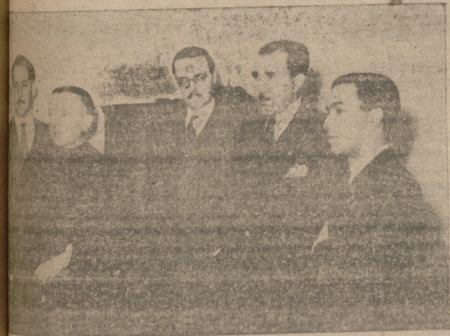
En el nuevo lugar la inauguración de la Escuela de Arte que la C. N. S. Burgos ha instalado en la calle Fernán González. En la "foto" las autoridades que asistieron al acto. -- (Información, en páginas interiores.).

VIII - Núm. 2024 | Burgos, Martes, 25 de Marzo de 1952 | Precio: 70 céntimos