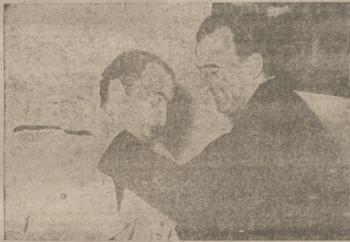
La "foto" de Villafranca recoge el momento en que el ministro de Educación Nacional, señor Ruiz Jiménez, impone las insignias de la Cruz de Alfonso el Sabio al gobernador civil y jefe provincial del Movimiento, Sr. Rodríguez de Valcarcel.

En un emotivo acto celebrado en la Diputación, Ruiz Jiménez exaltó las virtudes de los gobernadores civiles del último lustro