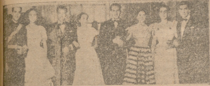
En uno de los bailes de sociedad del Círculo de la Unión, nuestro fotógrafo tiró este «flash». Pudió con infinidad de clichés similares, pero con éste estimamos demostrativo el reflejar la distinción que siempre hizo gala el Casino en sus bailes de noche.

Con seis mil pesetas se iniciaron las obras del edificio.-El título de «Muy Benéfica» le viene a Burgos por mediación del Casino.-2.322 socios en la actualidad y otros tantos que quieren ingresar.-Desde el ventanal al «tranvía», toda una sucesión de aciertos y solemnidades