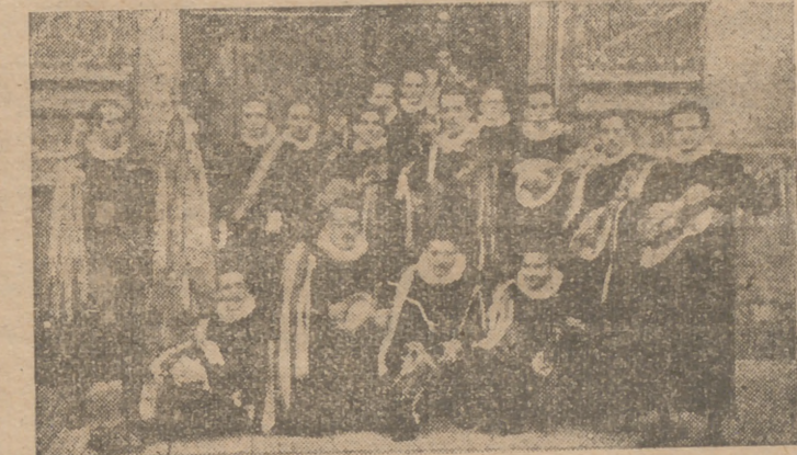
Manteo con cintas amorosas. Ras gar de vihuela por manos estudiantiles. Paso la tuna por el viejo Burgos y siempre encuentra el escenario propicio en el salón principal del Casino.

cios sigue creciendo y llega el primero de enero de este año con la cifra de 2.322, teniendo en cuenta que no se admiten nuevas inscripciones sino para cubrir vacantes, pues de acceder a todas las demandas, el número de aquéllos lle-