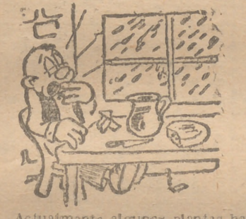
Actualmente algunas plantas han "aprendido" ya a desenvolverse casi sin auxilio de los rayos solares. En las proximidades del círculo Artico se crían ya ciertas variedades de trigo y de batatas.