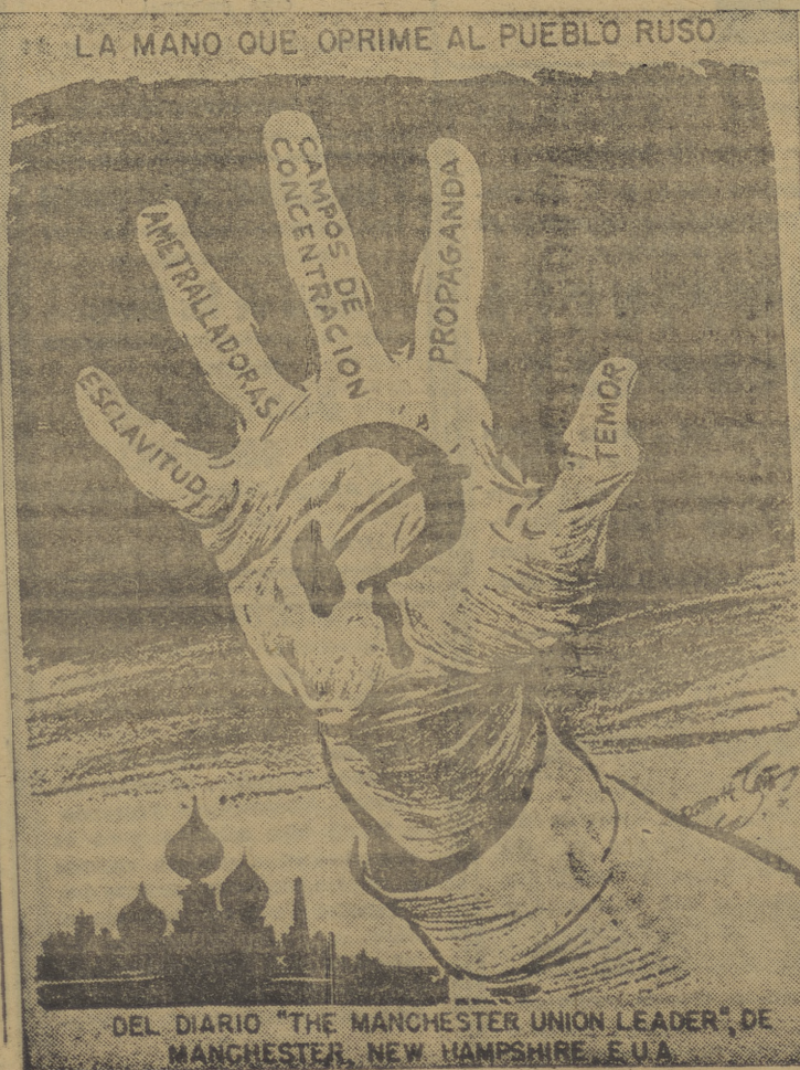
LA MANO QUE OPRIME AL PUEBLO RUSO

BARCELONA, 14.—La casa consignataria de los vapores "Mar Negro" y "Mar Adriático" anuncian la llegada para los próximos días de los citados buques, procedentes de los Estados Unidos, portadores de importantes cargamentos de algodón en rama para la industria textil española. El "Mar Negro" traerá seis mil ciento cuarenta balas de dicha fibra, además de dos mil ciento cincuenta y tres sacos de negro de humo, doscientos sacos de almidón y más de un millar de aceite lubricante, y el "Mar Adriático", que ya navegaba hacia Barcelona, otras catorce mil balas de algodón. Por otra parte se tienen noticias de que a mediados de enero llegará el "Mar Cantábrico" con dieciocho mil balas de algodón. (Cifra).