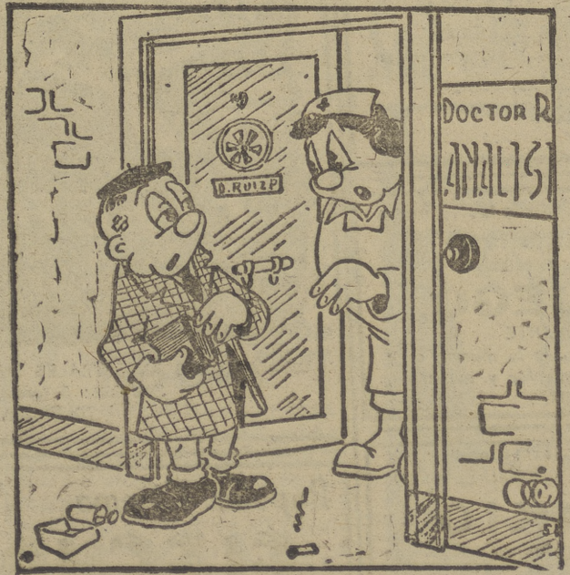
—¡Pase si quiere... pero no he oído nunca que aquí se haga análisis gramatical...!