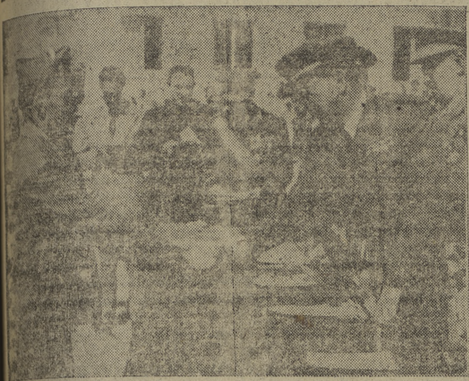
Momento de la entrega de despachos a los alléres de complemento de la Milicia Aérea Universitaria. (Información en tercera página)