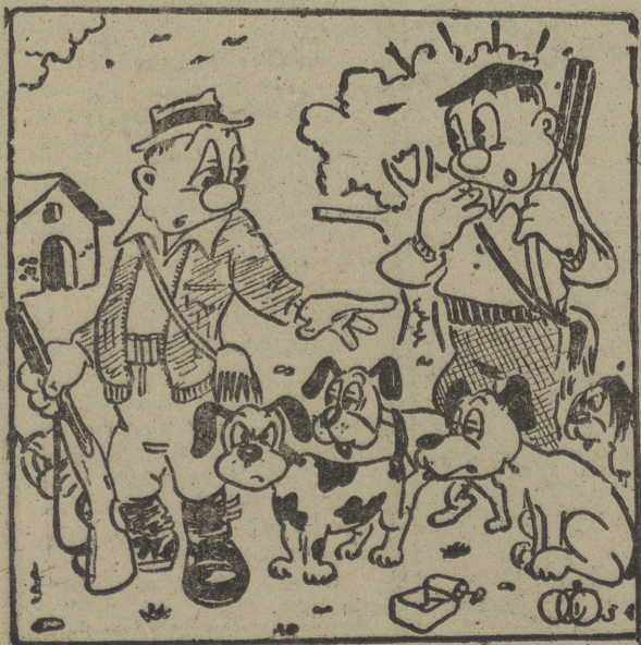
—Y... a todos estos perros hay que matar...?