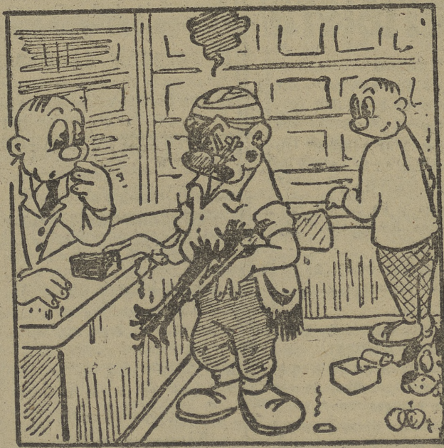
—¿Vd. fué el que me recomendó esta marca de carterhos?