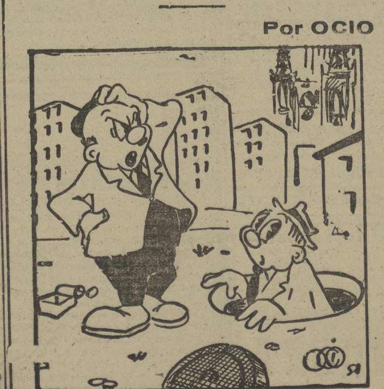
—Ya me parecía a mi que este "Metro" tardaba mucho en llegar a Diego de León...!