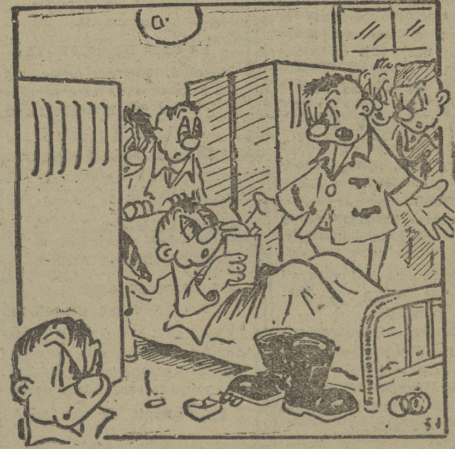
—¡Ya que tu novia se llama "Diana"... por lo menos no la nombres aquí, en voz alta...!!