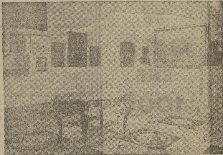
Rincón de la Sala de Arte Moderno que figuró en la Exposición de Burgos en Madrid el pasado mes de enero, con motivo de la concesión de la Medalla de Oro de Bellas Artes a nuestra ciudad.

En vista del éxito obtenido ayer tarde en el Paseo del Empecinado por el Teatro de Marionetas del Retiro y en obsequio a los niños burgaleses, el Ayuntamiento ha acordado dar el día de hoy dos representaciones, la una a las seis de la tarde, y a las ocho la segunda, las que tendrán lugar en el indicado Paseo del Empecinado.