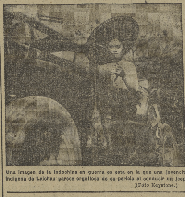
Una imagen de la Indochina en guerra es esta en la que una joven indígena de Lachau parece orgullosa de su perla al conducir un jeep.