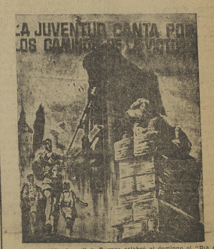
La Organización Juvenil de Burgos celebró el domingo el "Día de la Canción" con varios actos que reseñamos en segunda página.