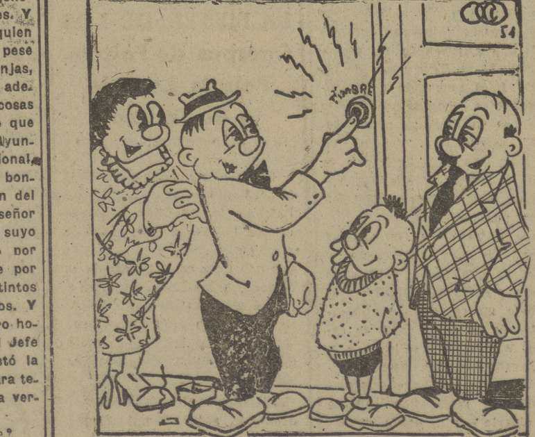
—¿Cómo se conoce, hijo, que has aprobado el quinto año de música...?