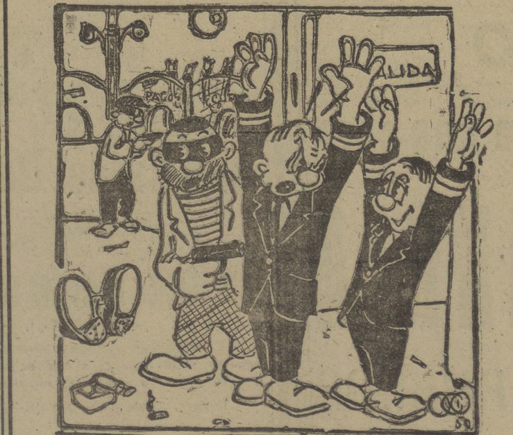
El otro: — ¡Y qué, que hoy sea 28 de diciembre...?!