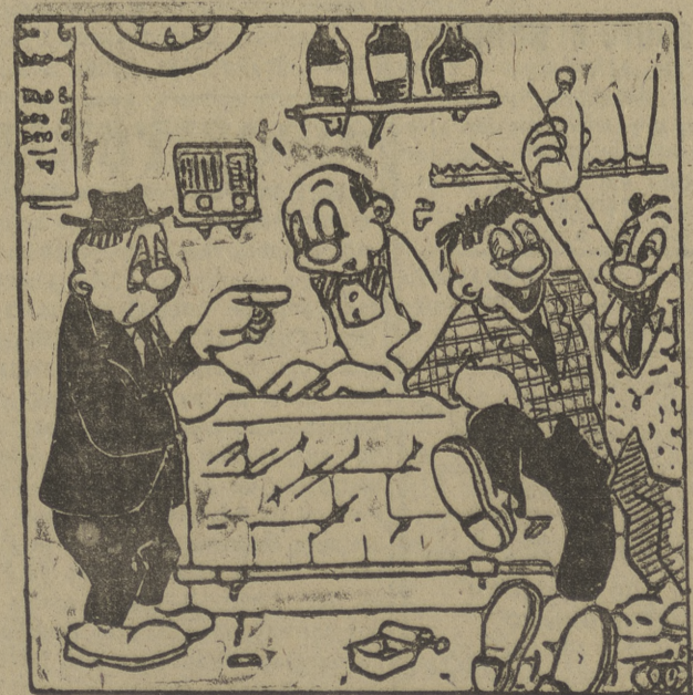
—¡Deme una copa de lo mismo...!