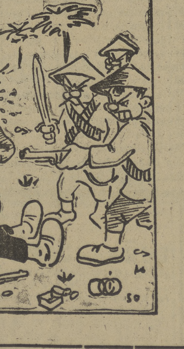
— ¡El me tiró primero...!!