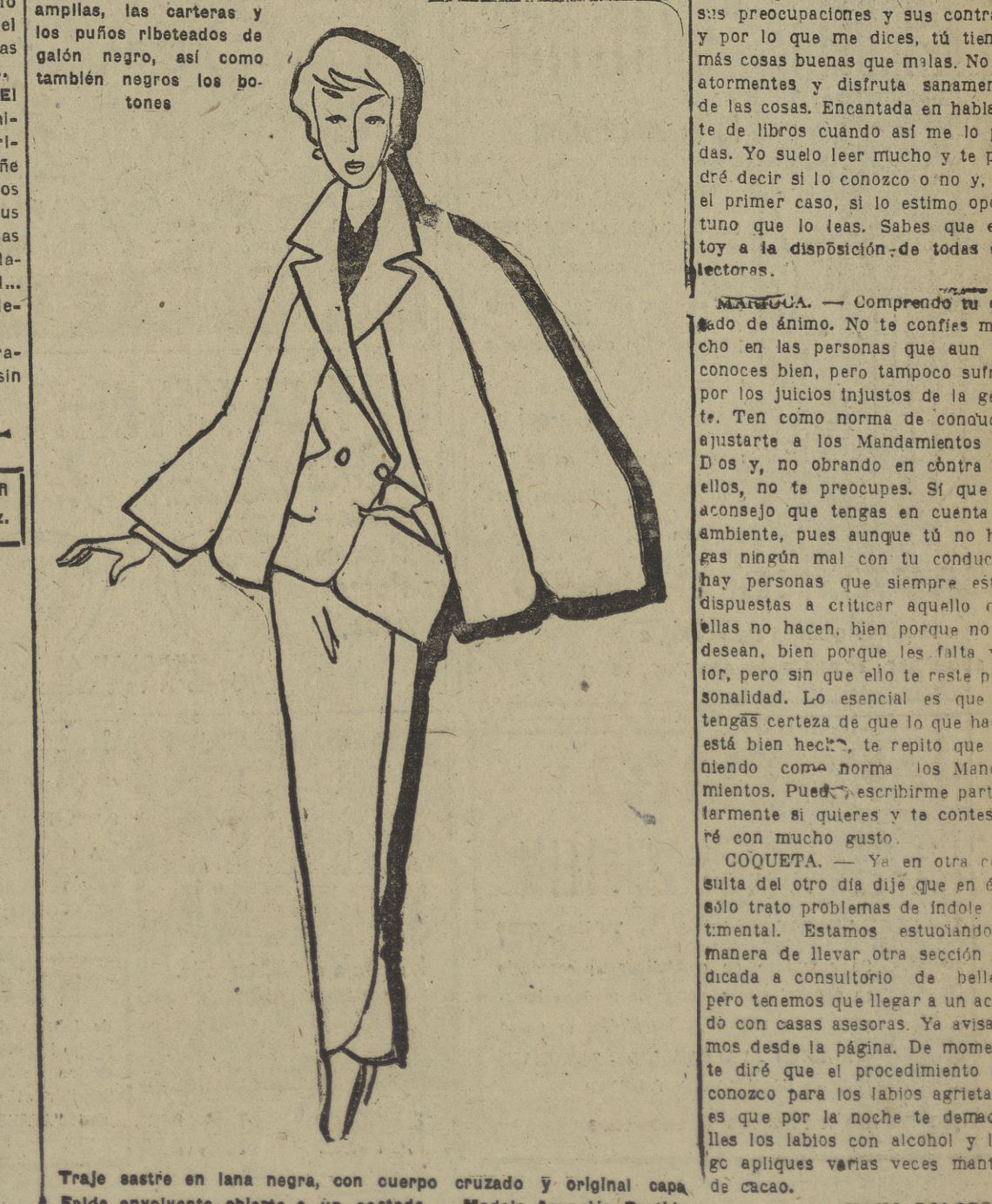
Traje este en lana negra, con cuerpo cruzado y original capa. Falda envolvente abierta a un costado. — Modelo Asunción Bastida.