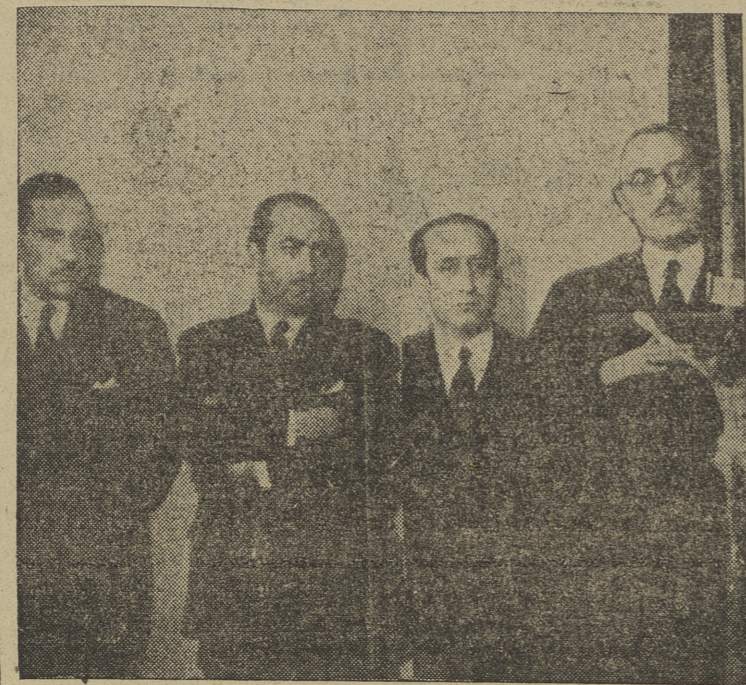
Las autoridades burgalesas, con el subdirector general de la Justicia Municipal, en el acto de inauguración de los nuevos locales del Juzgado Municipal de Burgos. — Información en páginas interiores.

¿Cerrará o hecho la bomba atómica? Dios haga renacer la paz, a pesar de las nubes que se acumulan en el horizonte.