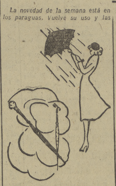
damas estiman hoy la supremacía del paraguas que protege su elegancia

de muselina. Las casas dedicadas a artículos de cuero han creado un puño muy ingenioso y práctico que sirve de estuche para la barra de los labios, el peine y los polvos. Se habla de un paraguas de mango luminoso que ilumine la cara de las señoras que los lleven y que, sin duda alguna, si duran las restricciones será de gran utilidad. Los elegantes "gentlemen" han puesto de moda los paraguas de caballero con puño de ébano o bambú, según las horas, y de tejido negro en sera nautical. También han creado un paraguas especial para viaje, con un pequeño bolso para llevarlo. Plegado, es pequeñísimo y no pesa nada. Todo él está confeccionado en nylon. Y junto a estos paraguas, unos impermeables para los perritos, haciendo juego con los tejidos en que se hallen conecionados aquellos y que se sujetan por medio de un collar dorado inoxidable.