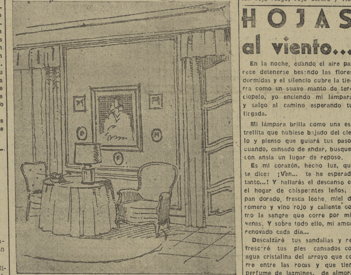
Pese a todos los procedimientos modernos que para dar calor a las casas gozamos en la vida actual, la camilla, con su aire humilde y bonachón de aldeana de amplias sayas, ha triunfado y seguirá triunfando en los hogares.

En el cuarto de estar representa el rincón más acogedor y familiar aquel donde la camilla se encuentra, y ésta parece como figura de abuela cariñosa alrededor de la cual se reúnen los nietos. Las horas de intimidad familiar, de lectura o de trabajo, cobran un tinte afectuoso, junto a ella. Esta que aquí os ofrecemos hoy es en pino corriente, cubierta por amplias alfombras en forma de capa de color rojo cereza, contrastando con el color crema de las paredes y con el verde botella de la pana que tapiza los sillones, ejecutados en madera clara. Un cuadro, de alegre colorido rodeado de algunas miniaturas de marco cuadrado unas y en forma de óvalo otras, una lámpara en batista con flores y una mullida alfombra en tonos de beige y marrón, hacen de este rincón un verdadero paraíso para esos días en que el viento sopla con furia y el frío intenso, hace bajar del cero a los termómetros.