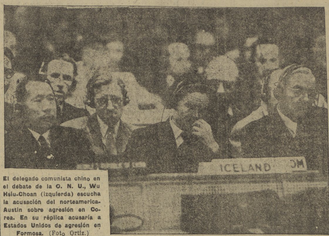
El delegado comunista chino en el debate de la O. N. U., Wu Hsiu-Chuan (izquierda) escucha la acusación del norteamericano Austin sobre agresión en Corea. En su réplica acusaría a Estados Unidos de agresión en Formosa.

La ciudad ha sido bombardeada ya con morteros pesados. Amenaza de un nuevo Dunquerque en la costa occidental coreana