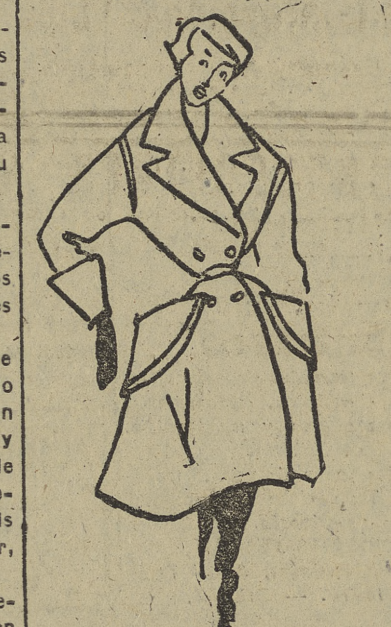
Chaquetón en gamuza roja, cruzado y con cuatro botones. Amplios bolsillos de doble cartera y puños bolillos de galón negro, así como también negros los botones.