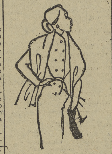
Vestido, en punto gris topo con original cierre y doble botonadura. Bolsillos irregulares en los costados. Falda tubo con tres godas bajas en la espalda.