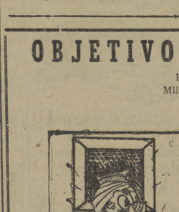
—¿No te dije yo, mamá, que en este curso me "estrellaba"...?

Envío: A los nuevos oficiales de la Milicia Aérea en su clausura de curso. Por OCIO