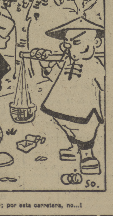
—¿Hong-Kong...? No, no; por esta carretera, no...