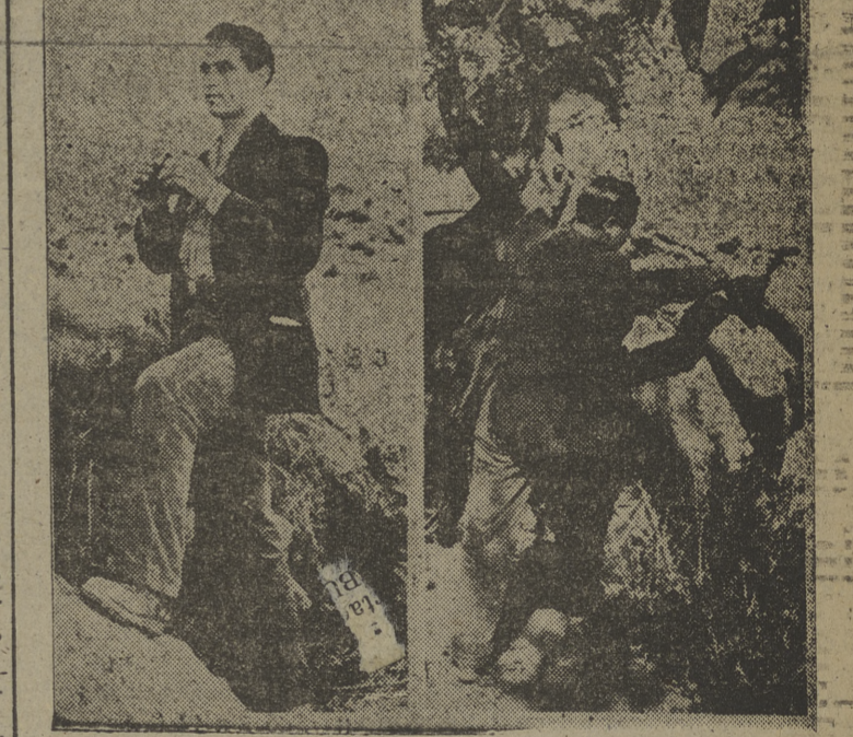
He aquí las dos últimas "fotos" de Giuliano hechas con su "permiso", cuando todavía era "Rey de las Montañas".