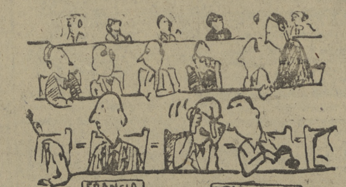
FRANCIA ESTADOS UNIDOS