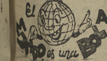
El mundo es una casa