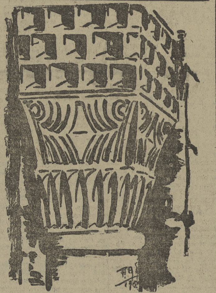
Hace unos días dimos a conocer a nuestros lectores uno de los capiteles de las ventanas de la Torre Ciudadana de San Pedro de Cardena. Hoy publicamos el último descubierto. La originalidad de él es manifiesta y su estilo bizantino puede situarse en los últimos momentos del arte visigótico, en su unión con los primeros albores del románico, pero no somos nosotros os que hemos de decir la última palabra sobre este monumento, único en Castilla, y del que plumas autorizadas habrán de hacerio en fecha próxima. (Dibujo de F. ALONSO SORIA.)

Cuando se logre tender líneas a través del Sahara Inglaterra, Francia y todos los países interesados en la explotación del Sahara como medio de comunicación, están aportando numerosos medios para instalar sobre su suelo movetizo líneas de hierro. Sufren con el día en que es posible atravesar el desierto en cómodo "Pullman". Desde el Mediterráneo hasta el Golfo de Guinea podrá llegar en pocos días, dentro de muy poco tiempo, Tombuctú, la villa misteriosa y lejana de África, con siderada en otros tiempos como inaccesible, verá llegar pronto los trenes eléctricos de motores "Diesel" por los caminos férricos que se construirán para el desierto.