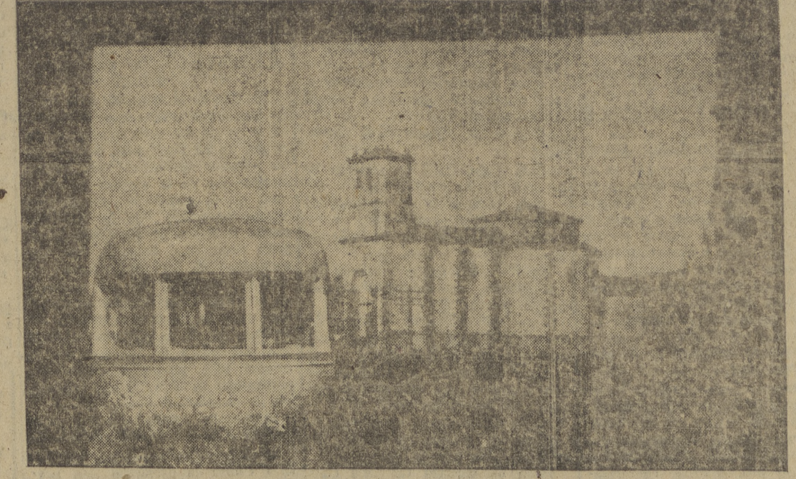
A los pies de la ermita de Nuestra Señora de la Blanca—devoción y tradición—, en Cebrejas del Pinar, el "Talgo" pone la nota blanca y vanguardista en su rodar a través del manto verde de los pinos, hacia Soria, en el viaje que realizó ayer.

ANUNCIAS recibidas de Washington, Londres, Sydney, Manila y otras ciudades interesadas anuncian que la nota rusa pidiendo el procesamiento de Hiro-Hito, no tiene posibilidad de ser "reducido", suponiendo que los Gobiernos aliados rechazarán "argüentemente" la solicitud comunista japonesa de "reducir" con esta nueva actitud.