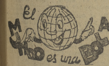
El mundo es una bola.

BERLIN. — El tráfico de la autopista desde el Oeste de Alemania a Berlín es normal hoy, por primera vez desde que los soviéticos iniciaron hace ocho días el semibloqueo. No hay demoras en el paso de camiones por el puesto de control de Helmsdorf. (Efe.)