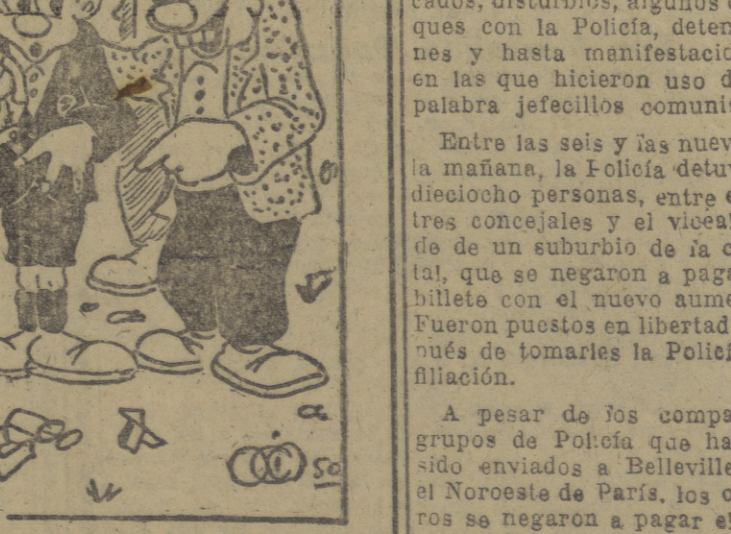
Arbitro: —Aquí, pagan ustedes antes, o después del partido? Directivos: —En el mismo partido, en el mismo partido es donde "cobran" todos...!