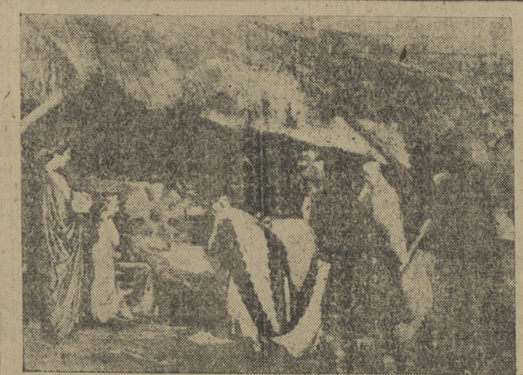
La brillante cabalgata de los Reyes Magos recorrió ayer las calles de la ciudad. La "foto" de Villafraanca recoge el momento en que sus majestades acuden a adorar al Rey de Reyes en el belén instalado en la Puerta de Sarmantal. Millares de niños contemplaron el momento emotivo.

¿Le ha tocado a Vd. el 42.370? MADRID, 5. — En el sorteo de la Lotería Nacional celebrado en el día de hoy han resultado agraciados con las cantidades, que se indican los siguientes números: PREMIADO CON DOS MILLONES DE PESETAS 42.370.—Madrid, Barcelona, Santander, Palma de Mallorca, Madrid, Avilés, Coruña, Madrid, Madrid. PREMIADO CON UN MILLÓN DE PESETAS 28.661.—Valencia, Barcelona, Madrid, Valencia, Madrid, Famploña, Madrid, Murcia. PREMIADO CON 300.000 PTAS. 23.109.—Sevilla. PREMIADO CON 50.000 PTAS. 43.225.—Madrid, Barcelona, Valladolid, Bilbao, Madrid, Avilés, Oviedo, Madrid, Getafe. PREMIADO CON 20.000 PTAS. 17.326.—Sevilla, El Ferrol del Caudillo, Valladolid, Valencia, Madrid, Barcelona, Valencia, Madrid, Gandia. PREMIADOS CON 15.000 PTAS. 933.—Pola de Siero, San Sebastián, Valladolid, Oñate, Madrid, Barcelona, Barcelona, Zaragoza, Santander. 3.280.—Avila, San Sebastián, Murcia, Santander, Barcelona, Barcelona, Barcelona, Zaragoza. 29.924.—Zaragoza, San Sebastián, Bilbao, Zaira Madrid, Valencia, Bilbao, San Sebastián, Madrid. 37.933.—Valencia. 41.070.—Madrid. 52.612.—Bilbao. 54.703.—Moreda. 54.764.—Vigo. (Cifra.)