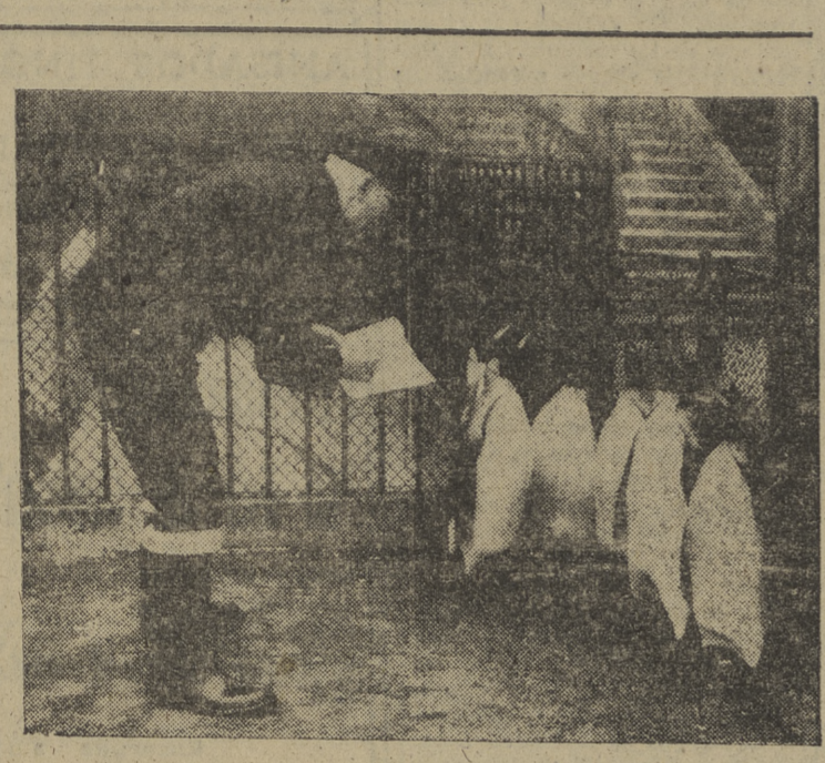
Un cuidador de un Zoo comprueba que no falta a la revista ninguno de los pingüinos a su cargo.

cer. Vísperas de fiesta. Amsterdam huele a pino y a Noche Buena. Los "grachten", anillos de canales que dan a esta ciudad —a todo el país— el aspecto de una inmensa Venecia, reflejan la luz color naranja de los faroles callejeros. Un orgullo descomunal, de made