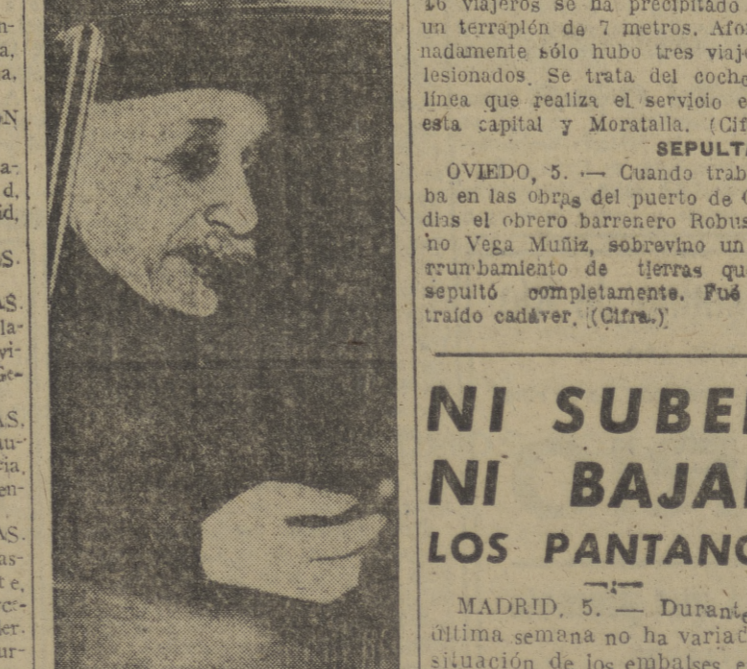
He aquí al famoso profesor Einstein, autor de la teoría sobre la gravitación, teoría que ocupa nada menos que veinticuatro folios mecanografiados de complicadas operaciones matemáticas. Si aquella es aprobada, podrá demostrarse, según la misma, los más leños movimientos físicos del universo.

SEPULTADO OVIEDO, 5. — Cuando trabajaba en las obras del puerto de Candás el obrero barcelonés Robustiano Vega Muñoz, sobrevino un derrumbamiento de tierras que le sepultó completamente. Fue extraído cadáver. (Cifra.)