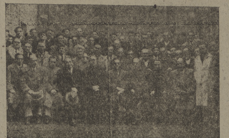
Empleados municipales, reunidos con varios concejales del Ayuntamiento, con motivo de la festividad de su Patrono, Santo Domingo. — Información en segunda página de nuestra edición para Burgos.