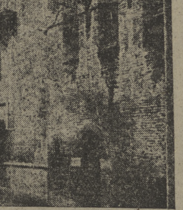
Fachada lateral de la Casa de Cervantes que próximamente será inaugurada en Bolonia, como adscrita al Colegio Español de San Clemente.

LISBOA — (Crónica de nuestro corresponsal, Adolfo Lizón). El puerto de Lisboa se encuentra en franca crisis. Desde el fin de la guerra, las grandes líneas transatlánticas se han desviado y Lisboa, que antes era puerto crucial, vino a quedar en la tangente al margen, fuera de ruta. Es fácil imaginarse lo que tal estado de cosas perjudica a la economía portuguesa, pendiente en todo momento de la capital del país. Para calmar, ya que no resolver totalmente, la crisis a que nos referimos, se intenta ahora la creación de una zona franca. La idea no es nueva, pues ya el marqués de Pombal, en pleno siglo XVIII, intentó la creación del puerto franco de Lisboa, aun antes de Lisboa tener puerto. Lo que puede llamarse en puridad puerto, se proyecta hace un siglo y tan sólo en 1887 se realizó gracias a los máximos ingenieros lusitanos: Hintze Ribeiro y Augusto de Aguiar, a los que en memoria de su obra fueron dedicadas dos de las avenidas lisboetas más galanas, ricas y espaciosas. Sin embargo nadie logró conseguir que el puerto franco fuese definitivamente establecido.