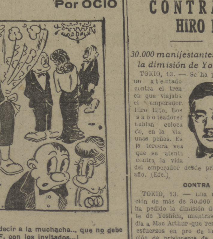
«No te olvides de decir a la muchacha... que no debes discutir del Burgos C. F. con los invitados...»