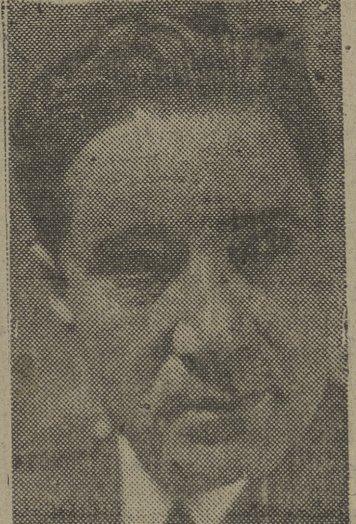
Visitó el campamento de la M. A. U. en Villafra

Ayer al mediodía llegó el presidente de Logroño, en automóvil, al aeródromo de Villafra, el ministro del Aire, general Gallarza, a quien acompañaban su esposa, hijos y ayudantes. Visitó detenidamente las obras donde se está instalando la Academia de la Milicia del Aire Universitaria, siendo ampliamente informado por el teniente coronel Bengoechea, jefe del curso, y el capitán Goya, acompañados de profesores y oficiales, quedando completamente satisfecho de las instalaciones que se han realizado. Posteriormente vino a Burgos, en unión de sus acompañantes, dirigiéndose al restaurante «El Castellano», donde almorzó, y a las cuatro continuó su viaje con dirección a Madrid.