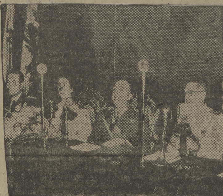
Su Excelencia el Jefe del Estado, acompañado de su esposa, ministros de Industria y Comercio, Gobernación y Justicia, con otras personalidades, en el acto de inaugurar la XVII Feria Internacional de Muestras en el palacio de Proyecciones.

El Sr. Rodríguez de Valcárcel inaugurará hoy en Tosantos el servicio de energía eléctrica. Los días son cortos para la obra de Alejandro Rodríguez de Valcárcel, que en ese intenso labor con el más ilusionado afán de superación, va llegando a todos los rincones de la política constructiva y eficaz al arrullo de la más cariñosa gestión. Hace unos días, exactamente el 7 de junio, descargó una tormenta sobre Fuentelesped que produjo una pérdida de cuatro setenta millones de pesetas. El día 7 fué la desgracia y ayer ya bura su tutela al pueblo, que ni que decir tiene, porque «no bura obliga», reclamó el gasto del gobernador civil. Hoy, siguiendo esta misma trayectoria, Valcárcel inaugurará en Tosantos el servicio de energía eléctrica, máxima aspiración de la fecha.