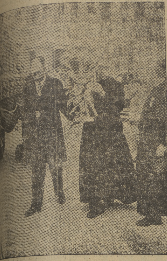
En la procesión de San José de Calasanz, durante la procesión que se celebró en la Plaza de la Armería, se esperaban más de treinta mil niños de las escuelas de Madrid.