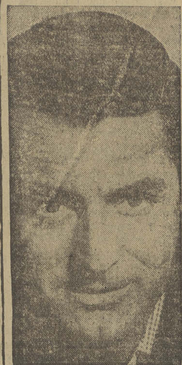
SE ESTRENA HOY EN EL AVENIDA Ver "Noche y día", tecnor de Warner Bros que se estrena hoy en realidad al más gigante y fastuoso espectáculo que jamás haya llegado a Burgos.

LIMOGES, 28.— Un jardinero del pueblo de Argenteuil ha recolectado en su jardín un espárrago gigante de 55 centímetros de altura y 350 gramos de peso.