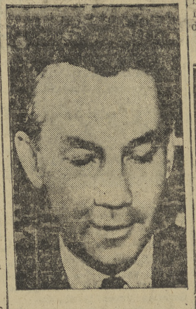
Forrestal surtirá efecto a partir del 31 de marzo.

WASHINGTON, 3. — Ha presentado la dimisión de su cargo de secretario de Defensa de Estados Unidos, James Forrestal, y ha sido designado para reemplazarlo Louis A. Johnson, según ha declarado hoy el presidente Truman a los periodistas. La dimisión de