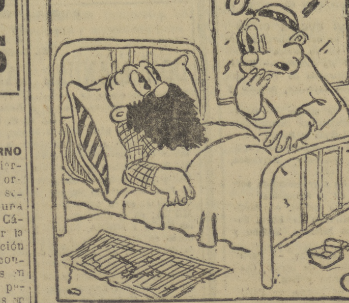
—¡Abra usted la boca! —¡Ya está...!