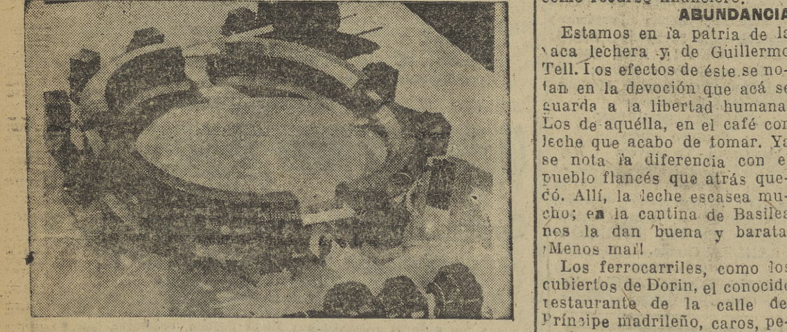
Maqueta de lo que será el Sincrotrón de energía nuclear de los Laboratorios Nacionales de Brookhaven, en Pathogue, Long Island, Nueva York. Este gran aparato se utilizará para obtener información básica sobre la estructura del átomo

COMPUTER Carácter blanco, despreciable, amable, de escasa voluntad. Indudablemente reservado, sólo se iraquea cuando le conviene. Si le acomoda, miente sin temor. Poco energético, aunque con arrebatos breves de impaciencia. A pesar del pseudónimo, poca confianza en sí persona y en el futuro. Tierno, amable. Debe vencer su apatía.