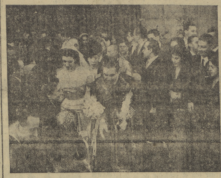
D. Cristóbal Colón, duque de Veragua, a la salida de San Francisco el Grande, después de su enlace matrimonial con la señorita Anunciada Gorosabe y Ramirez de Haro, nieta del duque de Medinasiona.