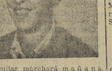
Aguiar marchará mañana a miércoles, a su nuevo club.