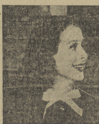
Esta es Hedy Lamarr -- la simpática Hedy Lamarr -- que en fecha próxima, y junto con Clark Gable, se presentará en la película "El camorrista", que será proyectada en uno de los cines de nuestra ciudad.