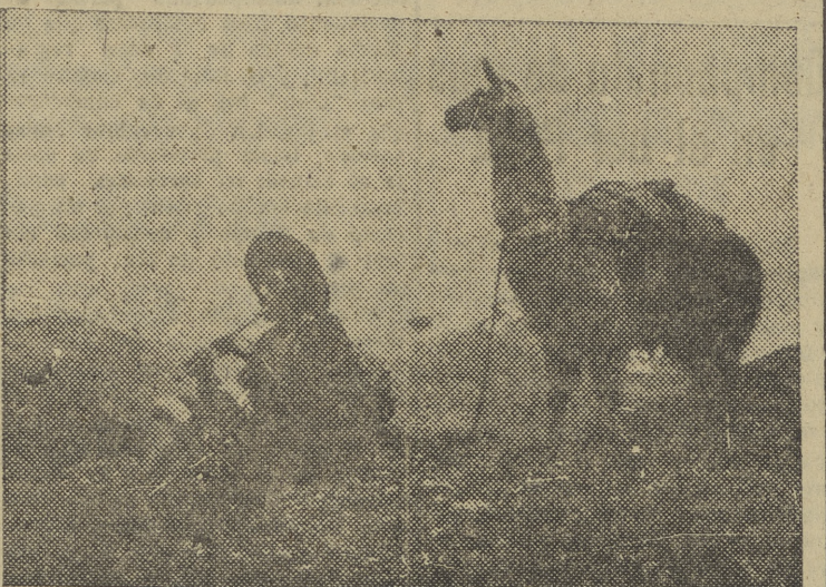
Paisaje de los Andes argentinos son la típica llama, y un pastor tafiendo la "queña"

Se están trayendo al país miles de emigrantes italianos. Todos ellos lo solicitaron previamente. De entre las peticiones se desecharon muchas y