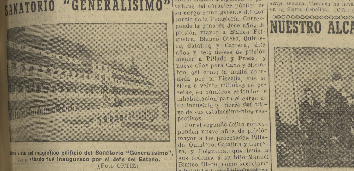
Una vista del magnífico edificio del Sanatorio "Generalísimo", que el sábado fue inaugurado por el Jefe del Estado.