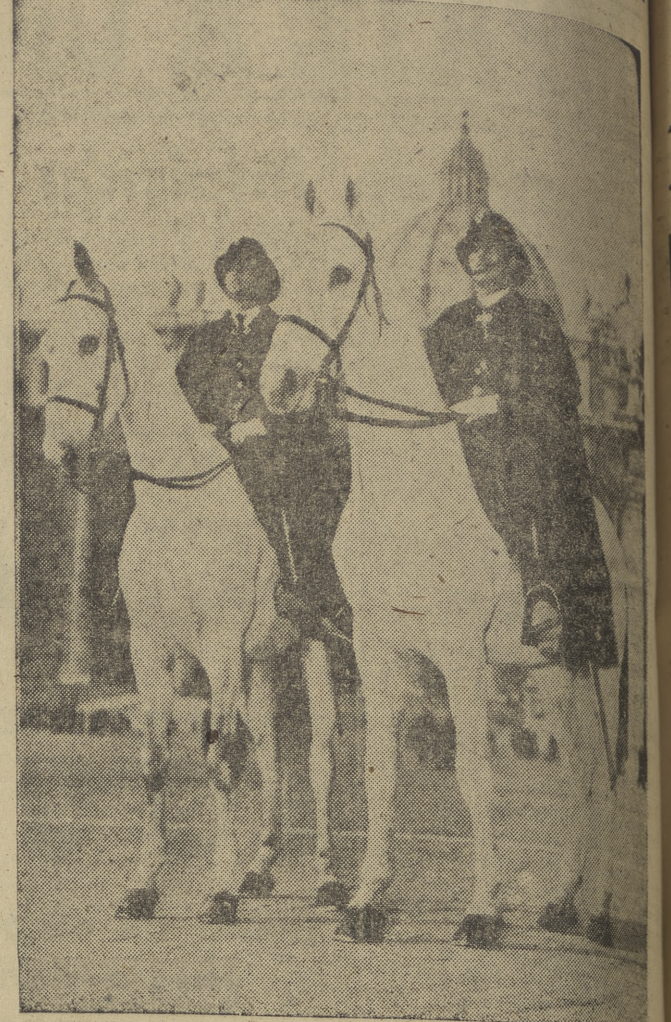
Por primera vez en la historia, la policía montada italiana penetró en territorio del Vaticano, con ocasión de la entrada entre De Gasperi y el Santo Padre. (Foto Ortiz.)

CIUDAD REAL, 21. -- Un nuevo pueblo va a constituirse en esta provincia, entre Manzanares y Valdepeñas, en la carretera general de Andalucía, con lo que se dará vida a aquella zona, a que entre dichas localidades hay unos veinte kilómetros sin un solo poblado. (Cifra.)