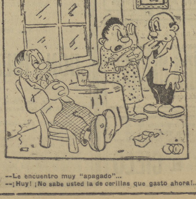
--Le encuentro muy "apagado"... --¡Huy! ¡No sabe usted la de cerillas que gastó ahora!...