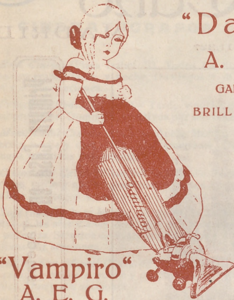
“Vampiro” A. E. G. LIMPIA TODO SIN TRABAJO ALGUNO