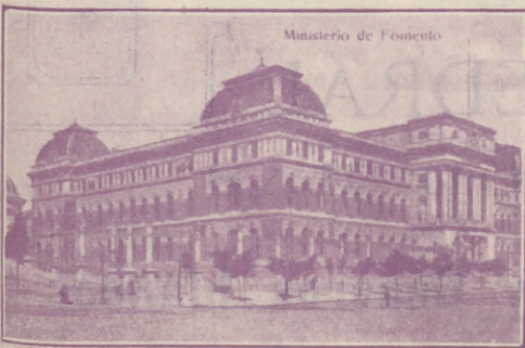
Ministerio de Fomento