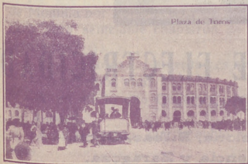
Plaza de Toros