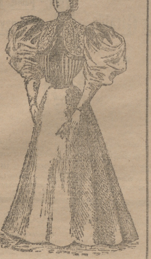
Traje de viaje

Otro modelo de un traje tan elegante como sencillo, y adaptado a todas las fortunas, podemos ofrecer hoy a nuestras amables lectoras.