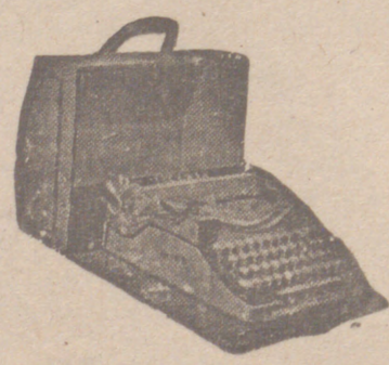
Máquinas de escribir portables y de mesa