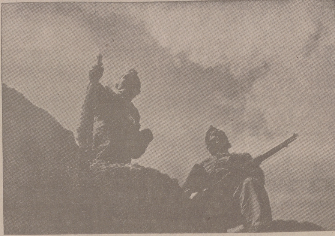
Por el honor de Dios y de España, nosotros os vengaremos, mártires del Ideal