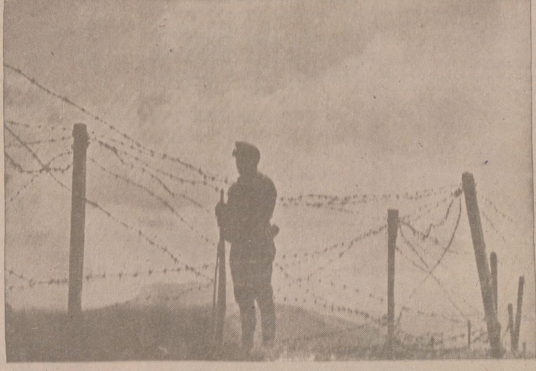
Si arrebató la muerte a su hermano de lucha, él ocupa su puesto en la vanguardia de España

Es poder atender a miles de necesitados cada día.