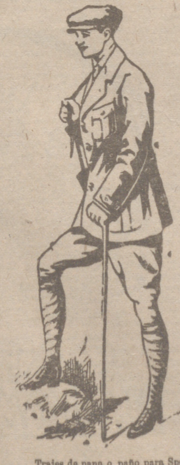
Trafes de pana o paño para Sport de 80 a 125 pesetas. BASTRERIA A MEDIDA