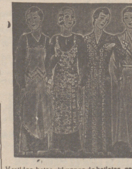
Vestidos, batas, kimono de batistas, percales o tricolores, de 7, 8, 9, 10, 12 y 14 pies.

Primera casa en conexiones para caballero, señora, jóvenes y niños Tejidos, Pañería y Sastrería