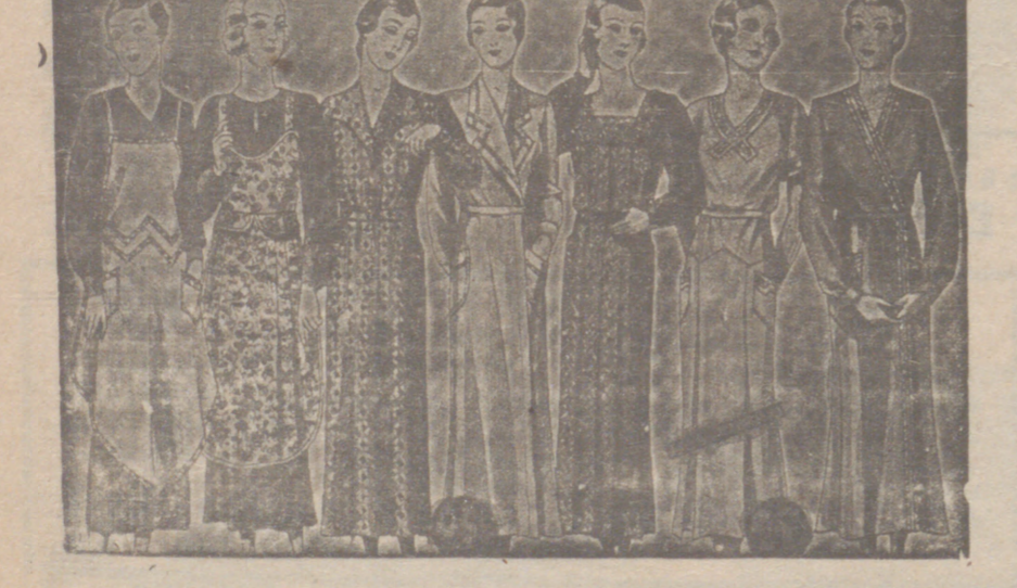
Vestidos, blusas, blusas, de batistas, percales o traualecos, de 7, 8, 9, 10, 12 y 14 pt

Primera casa en conexiones para caballero, señora, jóvenes y niños Tejidos, Pañería y Sastrería