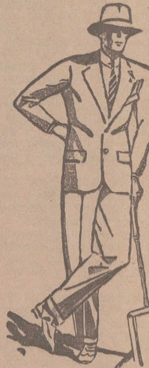
Trajes de paño, confección fina de 60, 70, 80, 100 y 120 pesetas GRANDES SURTIDOS