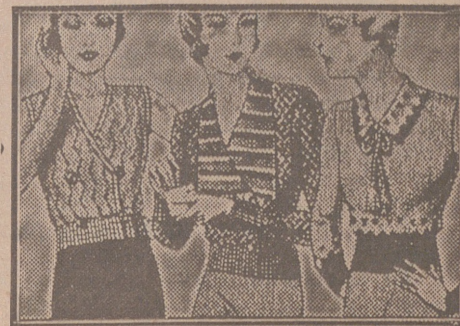
Blusas punto novedad, a 5, 6, 8, 10 y 12 ptas

Primera casa en confecciones para caballero, señora, jóvenes y niños Tejidos, Pañería y Sastrería