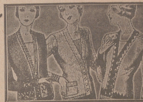
Blusas chaquetillas, de 7, 8, 10, 12 y 15 ptas.