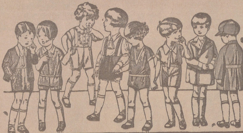
Diversidad de modelos en trajes para niños en punto, dril, lana o pana, de 5 a 15 pías.

Primera casa en confecciones para caballero, señora, jóvenes y niños Tejidos, Pañería y Sastrería