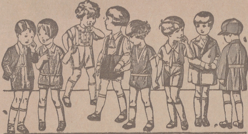
Diversidad de modelos en trajecitos para niños en punto, dril, lana o pana, de 5 a 15 ptas.

Primera casa en confecciones para caballero, señora, jóvenes y niños Tejidos, Pañería y Sastrería