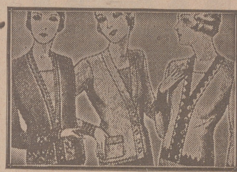
Blusas chaquéllas, de 7, 8, 10, 12 y 15 ptas.