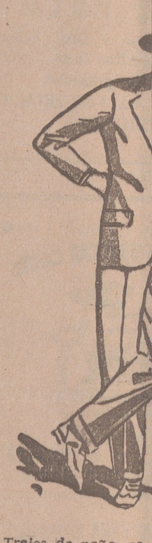
Trajes de paño, con de 60, 70, 80, 100 y GRANDES SU