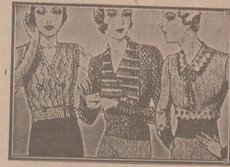
Blusas punto novedad, a 5, 6, 8, 10 y 12 ptas

Primera casa en confecciones para caballero, señora, joven Tejidos, Pañería y Sastrería