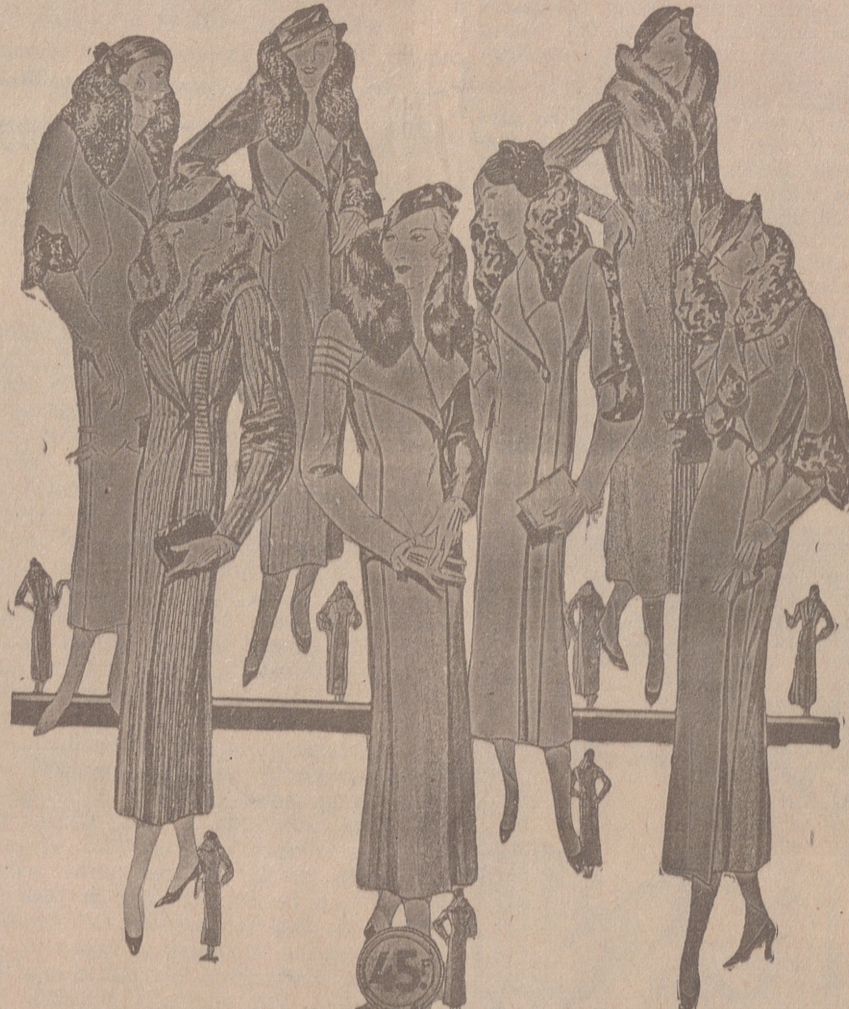
Abrigos señora, modelos novedad, a 20, 25, 30, 40, 50 y 60 pesetas. Abrigos para niñas, de 10, 12, 15 y 20 ptas. LA CASA MAS SURTIDA Y MAS BARATO VENDE

Casa Munguía ( Plaza Mayor, 48 y Lain Calvo, 9 Sucursal: Plaza Mayor 5 BURGOS Primera casa en confecciones para caballero, señora, jóvenes y niños Tejidos, Pañería y Sastrería