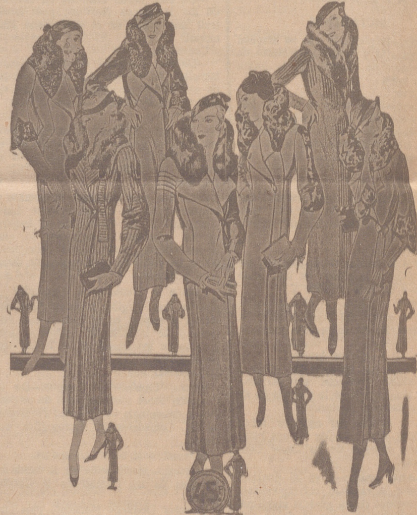
Abrigos señora, modelos novedad, a 20, 25, 30, 40, 50 y 60 pesetas. Abrigos para niñas, de 10, 12, 15 y 20 ptas. LA CASA MAS SURTIDA Y MAS BARATO VENDE

Primera casa en confecciones para caballero, señora, jóvenes y niños Tejidos, Pañería y Sastrería